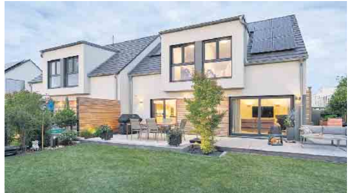
Doppelhaus in Fertigbauweise - das geht achsensymmetrisch oder auch grundverschieden.

ßen Vorteil: Die Planungs- und Baukosten werden durch zwei Parteien geteilt und sind dadurch geringer als bei zwei getrennt voneinander stehenden Einfamilienhäusern. Zudem lässt sich durch ein Doppelhaus wertvolle Grundstücksfläche einsparen, denn nur die Außenwände müssen den gesetzlich vorgeschriebenen Mindestabstand zu den Nachbargrundstücken einhalten. Der so gewonnene Platz kann für das Haus oder den Garten eingeplant werden. Auf einem kleineren Grundstück ist ein Doppelhaus mitunter sogar die einzige Chance auf zwei unabhängige Eigenheime und damit auf eine kostengünstigere Alternative zum Einfamilienhaus. Ein weiterer Vorteil des Doppelhauses, der gerade jetzt eine große Rolle spielt, ist dessen Energieeffizienz: „Holz-Fertighäuser werden heute immer als besonders effiziente und klimafreundliche Energiesparhäuser mit meist eigener Energiegewinnung realisiert. Das Doppelhaus in Fertigbauweise ist sogar noch effizienter, weil es eine Außenwand weniger gibt“, so Hannott. Diese Senke der Wohnnebenkosten beider Parteien und gebe bei einem zukunftssicher geplanten Doppel-Fertighaus mit fortschrittlicher Technik wie einer Photovoltaikanlage, einer Wärmepumpe und hauseigenen Speicherbatterie auf Jahre hin Kosten- und Versorgungssicherheit. (BDF/FT)