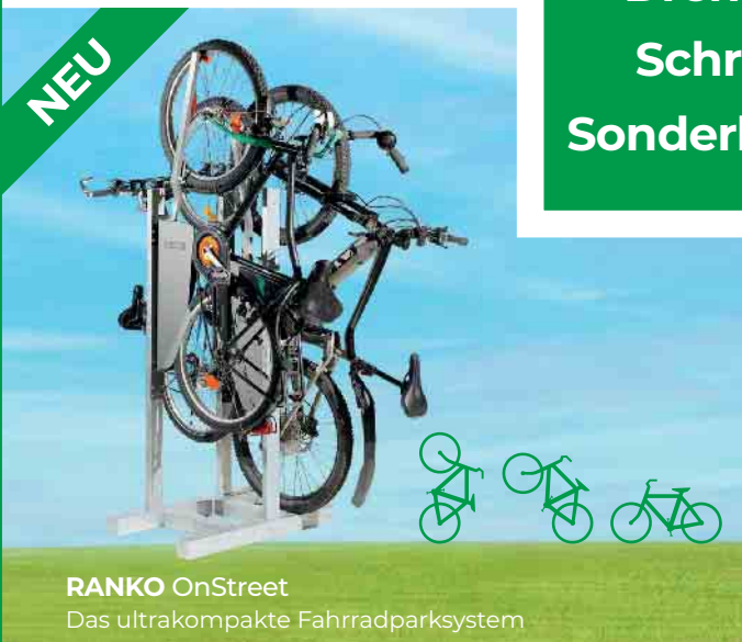
RANKO OnStreet Das ultrakompakte Fahrradparksystem

Zäune Tore Drehkreuze Schranken Sonderlösungen