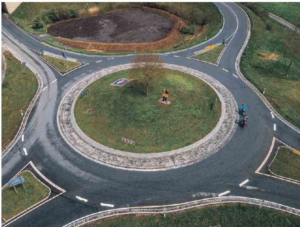
Berühmter Kreisel: Diesen Kreisverkehr kennen TV-Zuschauer aus den Eberhofer-Krimis.

chende Regelungen. So haben in Österreich einfahrende Fahrzeuge grundsätzlich Vorfahrt vor denjenigen, die sich bereits im Kreisverkehr befinden. In Frankreich haben in den Kreisverkehr einfahrende Fahrzeuge zwar grundsätzlich Vorfahrt, in den meisten Fällen wird aber den bereits im Kreis fahrenden Autos die Vorfahrt gewährt.