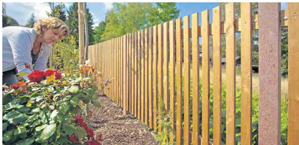
Vom Sichtschutz bis zum Terrassenbelag: Der nachwachsende Rohstoff Holz bietet für den Garten unzählige Gestaltungsmöglichkeiten.