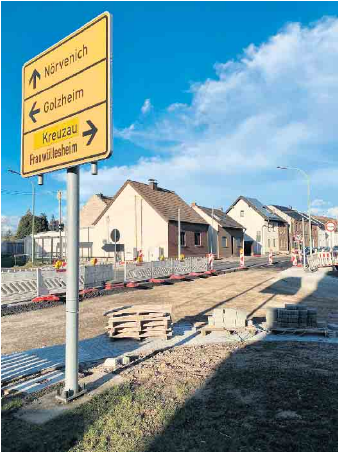
Vollsperrung Kreuzung L263/L327 für abschließende Asphaltarbeiten

ches erforderlich, welche terminlich auch aus Rücksichtnahme auf den (Schul-)busverkehr bewusst in die Osterferien gelegt und seitens der Straßenverkehrsbehörde (Kreis Düren) jetzt für den Zeitraum 03.04. - 06.04.2023 angeordnet wurde.