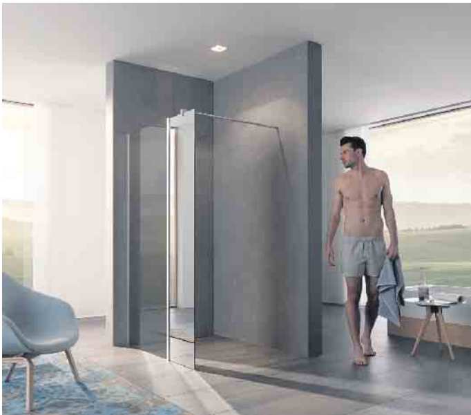
Transparente und teilverspiegelte Trennwände bei der Dusche bringen ein Gefühl von Weite - auch in kleine Bäder.