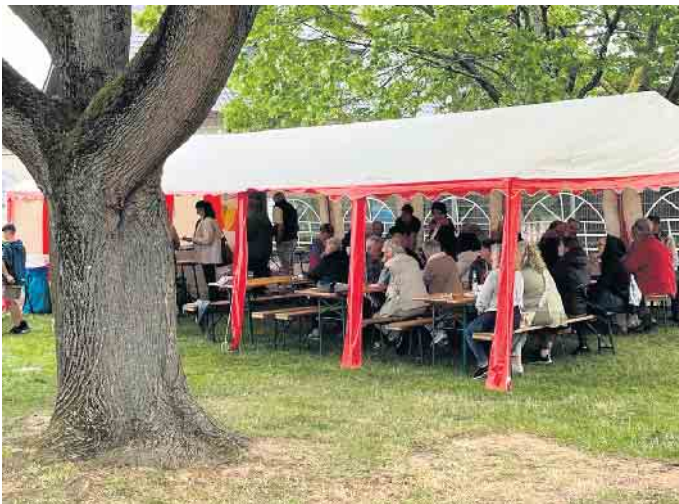
Heimatflimmern in Frauwüllesheim: Bei der Kirmes war der ganz Ort für zwei Tage auf den Beinen

Bei der Kirmes war der ganz Ort für zwei Tage auf den Beinen