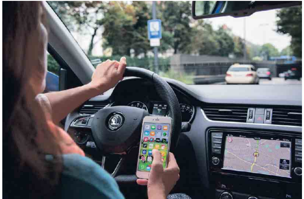
Schon eine Sekunde Ablenkung am Steuer bedeutet viele Meter Blindfahrt.

Beim Telefonieren, Schreiben und Lesen von Nachrichten können Tempo-, Blick- und Spurverhalten deutlich beeinträchtigt sein. Das gilt nicht nur für Autofahrer, auch auf dem Fahrrad, Pedelec oder E-Scooter wird die Gefahr einer kurzen Ablenkung meist unterschätzt. Sowohl für Pedelecs als auch für E-Scooter sind die Unfallzahlen in den letzten Jahren