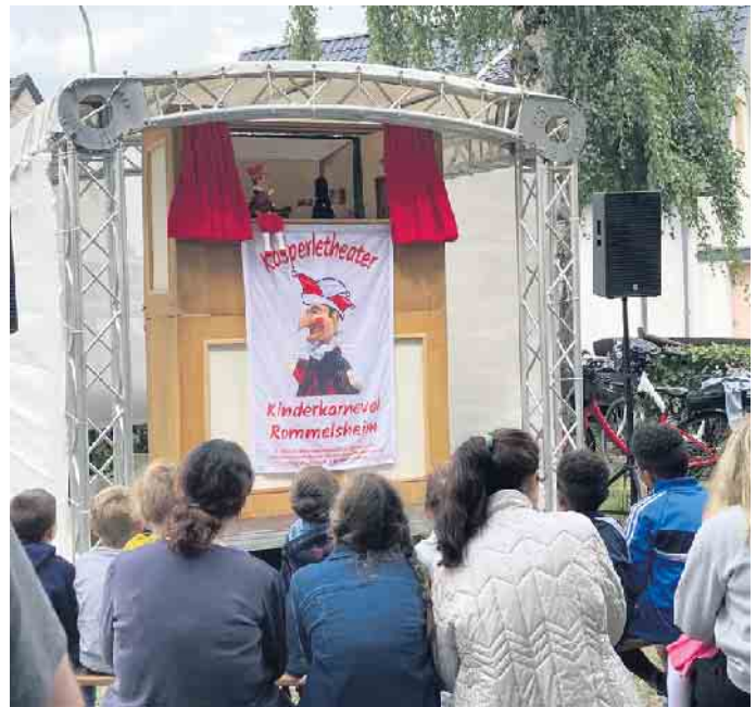
Am Nachmittag besuchte sogar der Kasperle die Kirmes. Auf dem Spielplatz war der Spaß groß, denn das Kasperletheater verliert nie seinen Reiz und sorgte für prächtige Stimmung

Für das zahlreiche Kommen bedanken sich an dieser Stelle recht herzlich alle Ortsvereine und -gruppen aus Frauwüllesheim. FH