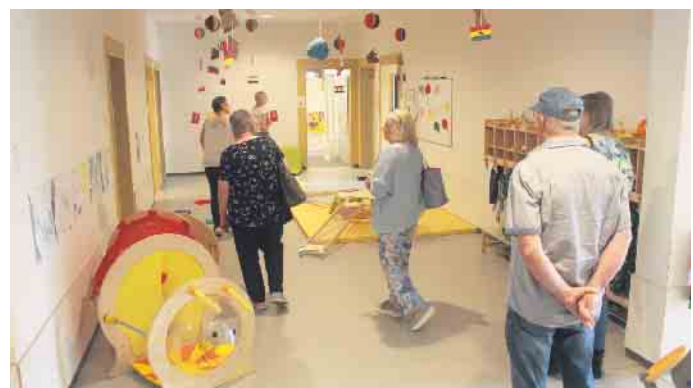
Interessierte führte das Team sehr gerne durch die Räumlichkeiten. In persönlichen Gesprächen erfuhr man weiteres über das pädagogische Konzept und weitere Schwerpunkte der Einrichtung

Mit diesem öffnen der Türe der Einrichtung wollte man erreichen, dass die Bürgerinnen und Bürger einmal die Burgmäuse besser kennen lernen. Denk man oft, es würden „nur“ Kinder betreut liegt man hier falsch. Das Angebot des Familienzentrums ist vielfältig und definitiv ein Besuch wert. Die Türen stehen allen offen. Das Kita/Familienzentrum-Team sowie die Kooperationspartner freuten sich über die großen und kleinen Besucher. FH