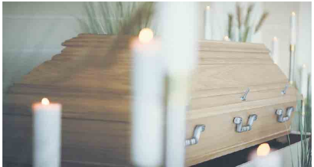
Für sehr große und sehr schwere Menschen gibt es maßangefertigte Särge.

Natürlich muss man auf die besonderen Bedingungen reagieren und entsprechend planen. Ob Erd- oder Feuerbestattung, für beide Abschiedswege wird ein Sarg benötigt. So kümmert