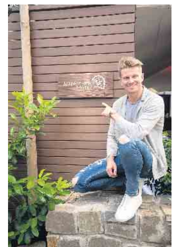
Formel-1-Rennfahrer Nico Hülkenberg hat sich auf den ersten Blick in die historische Mühle verliebt.