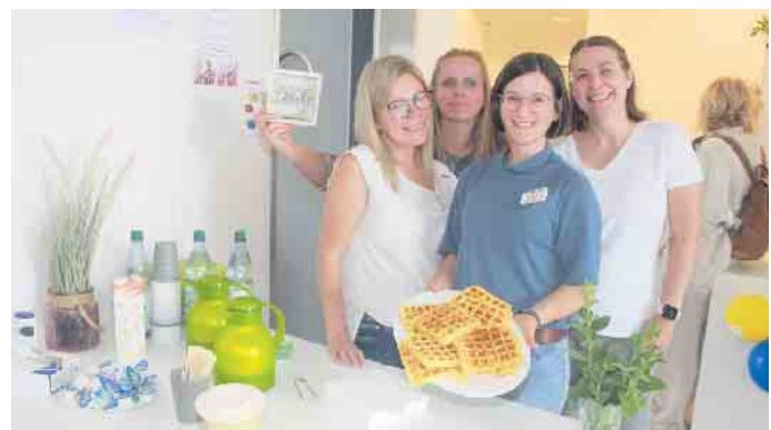
Bereichert wurde das Angebot an diesem Nachmittag durch eine Cafeteria. Bei Kaffee und leckeren heißen Waffeln sowie zahlreichen Getränken konnte die Zeit nach Herzenslust genossen werden