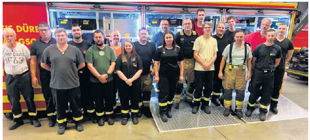
Anfang Juli informierten sich die Feuerwehrleute der Löschgruppe 21 (Nörvenich-Oberbolheim) über die neuesten Geräte und Konzepte

Anfang Juli informierten sich die Feuerwehrleute der Löschgruppe 21 (Nörvenich-Oberbolheim) über die neuesten Geräte und Konzepte. FH