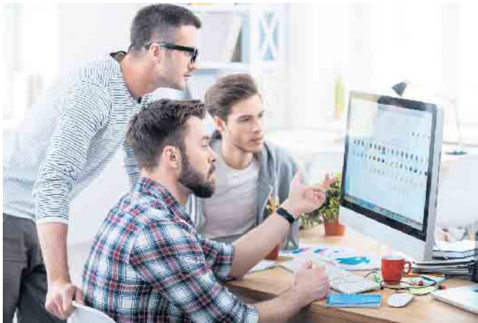
Fachkräfte werden in der IT-Branche händeringend gesucht. Für Quereinsteiger und Arbeitssuchende eröffnen sich mit einer Weiterbildung gute Berufschancen.