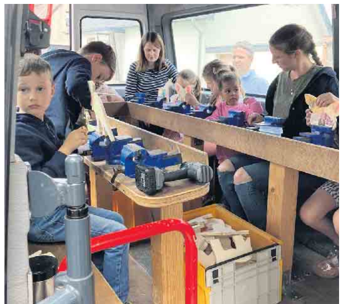
Im Bastelkönig konnten die Kinder unter Anleitung kreativ werden