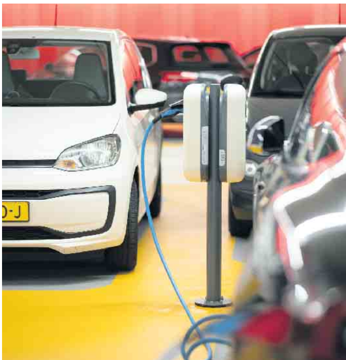
Die Elektromobilität nimmt auch in Deutschland langsam Fahrt auf: Die Zahl der Zulassungen weist steil nach oben.

lich weitere Kupfervorkommen in der Erde entdeckt. Vor allem aber wird der Werkstoff bereits heute zu einem sehr großen Teil wiederverwertet. (djd)