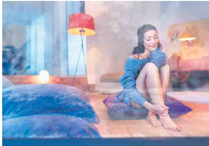
Wohlfühlen in den eigenen vier Wänden: Eine nachträgliche Dämmung von Dachboden und Kellerdecke senkt den Energieverbrauch und trägt zu einem angenehmen Raumklima bei.

Die Energiebilanz des Hauses zu verbessern, wirkt sich nicht nur positiv auf den eigenen Geldbeutel aus, sondern ebenso auf die Umwelt. Daher wird die Effizienzsteigerung staatlich belohnt: Mit