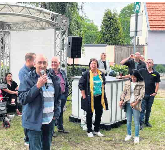
Impression vom Kirmessonntag

In den Kirmes-Sonntag startete man mit einer Heiligen Messe in der örtlichen Pfarrkirche mit anschließender Kranzniederlegung am Ehrenmal. Am Spielplatz wurde unterdessen fleißig vorbereitet, sodass am Mittag allerlei herzhaftes Speisen von der tollen Feuerzone oder Fritten genossen werden konnten. Auch kühle Getränke standen bereit. Für die kleinen Besucher lockte neben einer