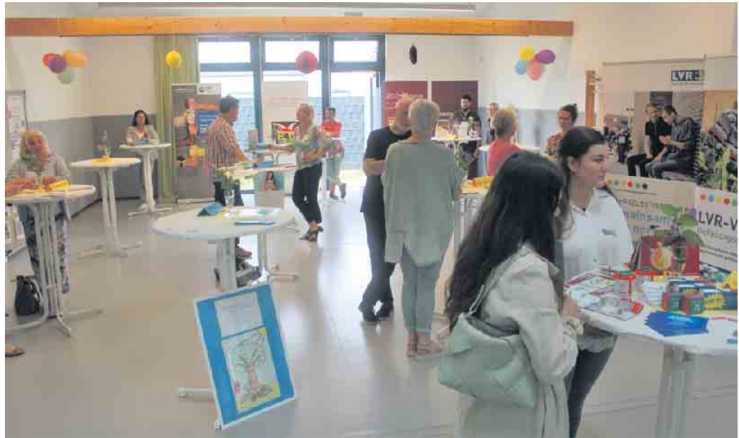
Zu einem Austausch mit den Kooperationspartnern lud die Kindertagesstätte Burgmäuse an der Dresdener Straße am 28. Juni recht herzlich zu einem Tag der offenen Türe für Jedermann ein

Am jetzigen Standort befindet sich die Einrichtung erst seit drei Jah-