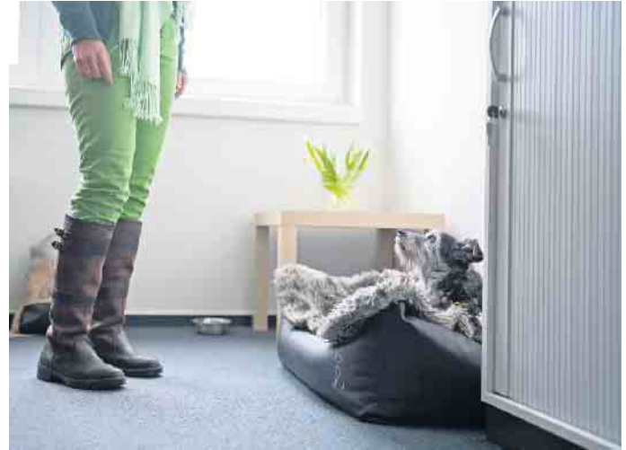
Kollege auf vier Pfoten: Hunde im Büro werden von vielen Unternehmen akzeptiert. Wichtig sind jedoch klare Regeln.