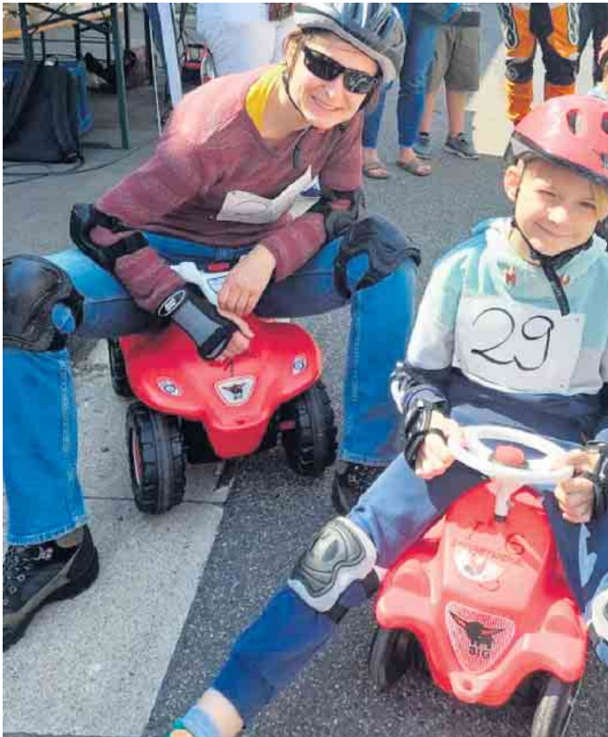
Zwei der 58 Teilnehmer 2022

Auf der Hauptstraße in Langerwehe am 12. August