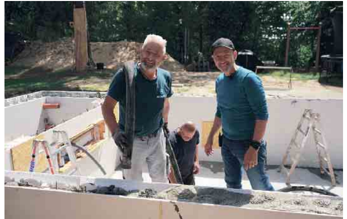
Gute Laune beim Poolbau.

beherrscht, ist ein Allroundtalent. Schließlich müssen Poolexperten umfassendes Fachwissen haben. Beckenbau und Bauphysik sind ebenso gefragt wie Energiegewinnung und Wasseraufbereitung. Oder anders gesagt: Von A wie Anlagentechnik bis Z bis Zukunftstechnologien ist alles dabei. Schwimmbadbauer kennen sich mit Energieeffizienz aus Immer wichtiger wird zudem, sich mit Energieeffizienz im Pool auszukennen. Schließlich will der Kunde von heute so ressourcenschonend wie möglich schwimmen. Und Poolbauer wissen, wie