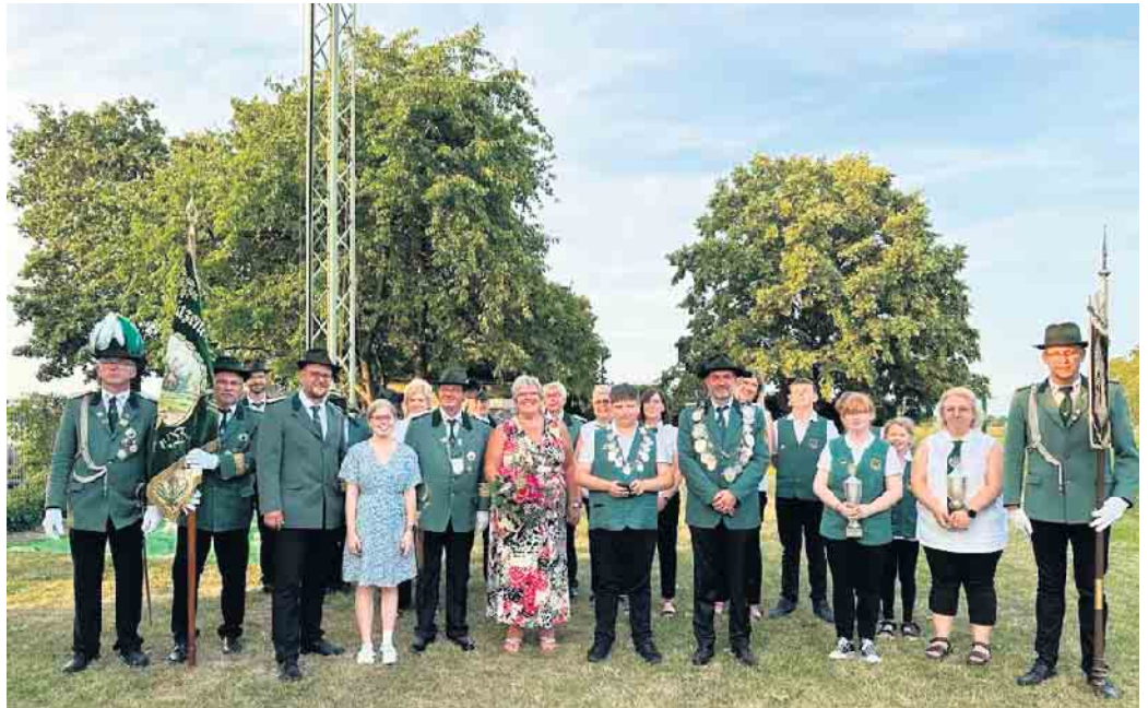
Die scheidenden und neuen Majestäten der Bruderschaft (vordere Reihe, v.l.n.r.)