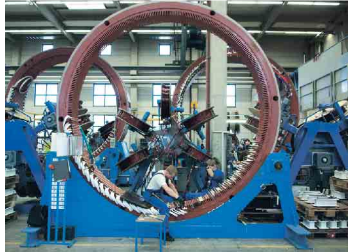
Industriemechanikerinnen und Industriemechaniker sind Experten, wenn es um den Bau, die Instandhaltung, Reparatur und die Bedienung von Maschinen und Produktionsanlagen geht.

Unverzichtbares Funktionsmetall Kupfer ist mit seinen über 400 Legierungen wichtiger Bestandteil innovativer Entwicklungen - ob in der industriellen Anwendung, der Energietechnik, der Architektur oder in der Informations- und Kommunikationstechnologie. Kupfer ist ein relativ weiches und dehnbares, aber auch widerstandsfähiges Metall, das sich gut verarbeiten und formen lässt. Legiert mit anderen Metallen kann es weitere Eigenschaften entfalten, darunter Härte, Festigkeit, Relaxationsverhalten und vieles mehr. Zu den bekanntesten Kupferlegierungen zählen Messing und Bronze. (akz-o)