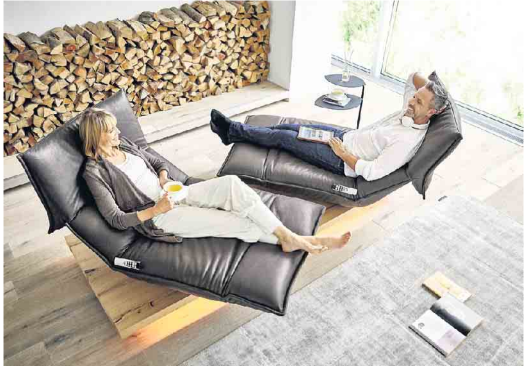
Wer sich zuhause lange und genüsslich niederlassen will, sollte vor dem Möbelkauf den Sitzkomfort gründlich checken.

„Am besten probiert auch die Partnerin oder der Partner beziehungsweise die ganze Familie neue Sitz- oder Polstermöbel aus, um sicherzustellen, dass etwa die Sitzhöhe, die Polsterung und die Lehnen allen späteren Nutzern eine komfortable Sitzposition ermöglichen - auch über mehrere Stunden hinweg“, sagt Winning. Schließlich sollte auch die Expertise des Verkäufers im Mö-