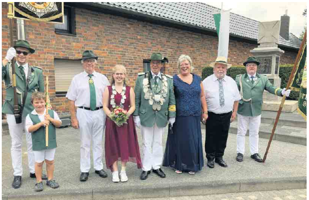
Impression des Schützenfest-Sonntag beim großen Festzug