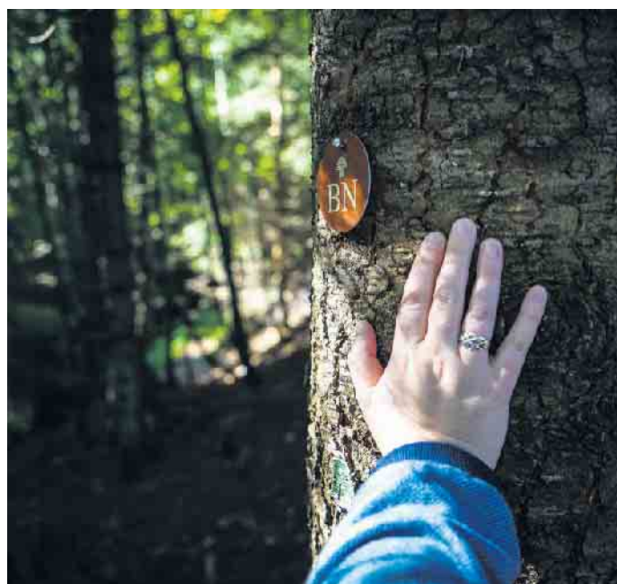
Der letzte Fußabdruck kann auch naturnah und damit umweltfreundlich sein.

Schließlich kennzeichne ein ökologischer letzter Fußabdruck ein hohes Verantwortungsbewusstsein für nachfolgende Generationen. „Ein solches Erbe möchten viele Menschen der Nachwelt sehr gerne hinterlassen“, schließt der Verbandsvorsitzende. (DS)