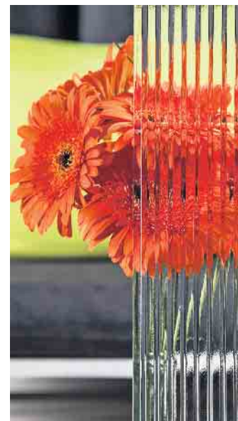
Auch Ornamentglas ist für Vögel sichtbar. Es hilft ihnen, Kollisionen zu vermeiden.

Ein neues Beschichtungsverfahren ergänzt das bisher eingesetzte Siebdruck-Verfahren. Die sicht-