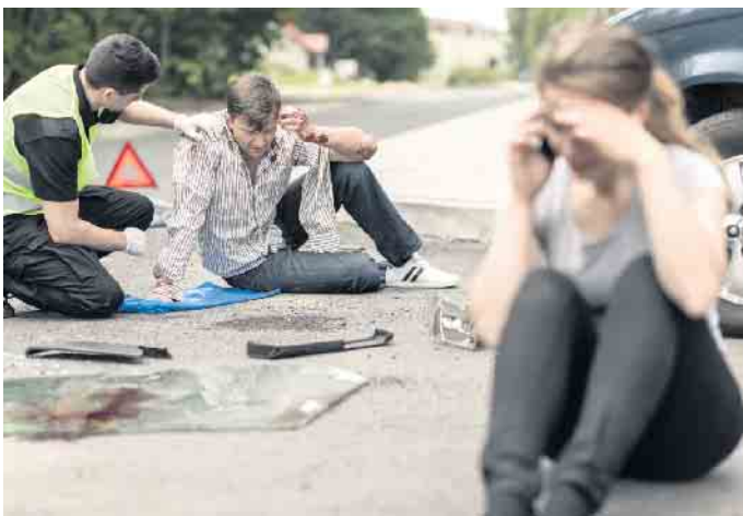
Jeder Mensch in Deutschland ist dazu verpflichtet, im Rahmen seiner Möglichkeiten Maßnahmen zur Rettung und Versorgung von Unfallopfern zu ergreifen.

Gesetzlich vorgeschrieben sei zwar nur eine Warnweste pro Pkw - es empfehle sich jedoch eine Weste pro Mitfahrer, um bestmöglich abgesichert zu sein. (djd)