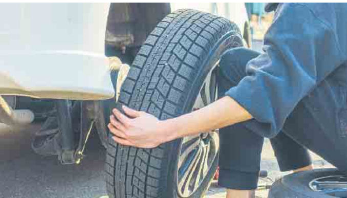
Reifenwechsel muss sein. Wer selber Hand anlegt, kann viel Geld sparen und ist auf der sicheren Seite.

Und der muss keine Frage des Geldbeutels sein