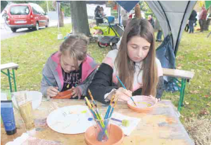
Während die jüngeren Bescher am Kreativtisch tolle Teelichthalter basteln konnten, waren die Erwachsenen zu einer Erbsen- oder Kartoffelsuppe eingeladen

Wissersheimer Wibbelstätze luden zum zweiten Herbstfest ein