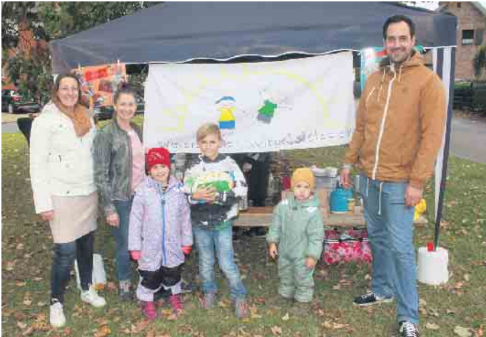
Die Bezahlung erfolgte auf freiwilliger Spendenbasis. Die Erlöse kommen alle selbstverständlich zu 100 Prozent den Wibbelstätzen zu Gute

zen sowie das Laub laden zum Hereinspringen ein. Viele Kinder haben in diesen Monaten besonders viel Spaß. So luden die Wibbelstätze, die aktuell rund 100 Mitglieder (aktiv und inaktiv) zählen, zum bereits zweiten großen Herbstfest ein. Los ging es am Samstag, 21. Oktober ab 13 Uhr auf der Dorfinsel, Ecke Kanisstraße/Gymnicher Straße. Verschiedene Angebote luden zu geselligen Stunden ein. Während die jüngeren Bescher am Kreativtisch tolle Teelichthalter basteln konnten, waren die Erwachsenen zu einer Erbsen- oder Kartoffelsuppe eingeladen. Zudem standen zahlreiche Kalt- und Warmgetränke zur Auswahl. Die