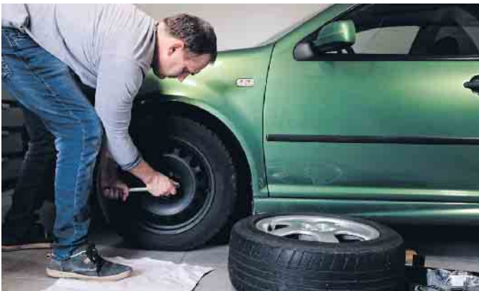
Reifenwechsel muss sein. Wer selber Hand anlegt, kann viel Geld sparen und ist auf der sicheren Seite.

le Jahre, denn mit abgefahrenen Reifen kommt man auch bei seiner Versicherung rechtlich schnell ins Schleudern. (akz-o)