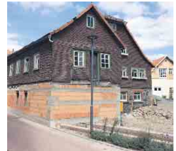
Bevor die Maler kamen, war die Mühle in einem traurigen Zustand.