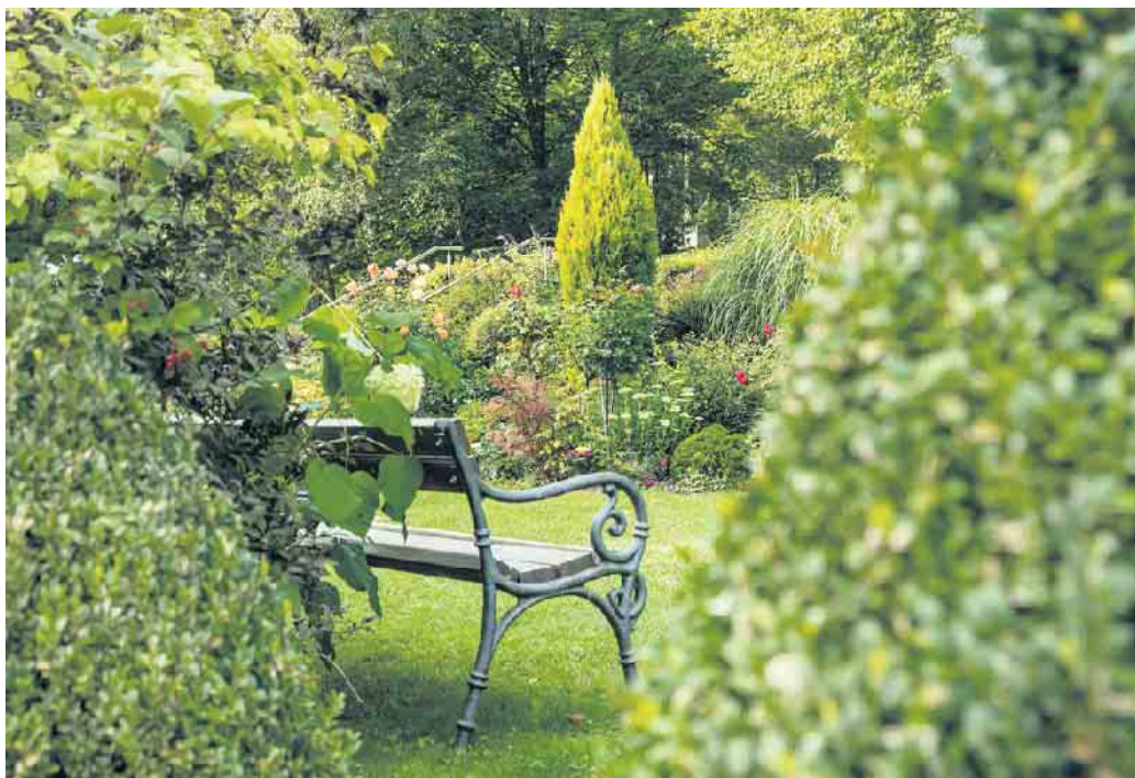
Rasengrab oder Bestattung im Blumengarten.

Urnenwand, Blumengarten oder klassische Beisetzung