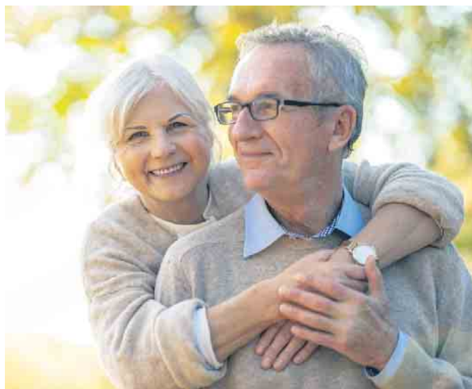
Viele Menschen bevorzugen individuelle Bestattungsformen und bestimmen bereits zu Lebzeiten das Prozedere für ihren letzten Gang.

Einhaltung der geltenden Corona-Bestimmungen können sich Interessierte auch ein Bild von der Manufaktur in der Schweiz machen. (djd)