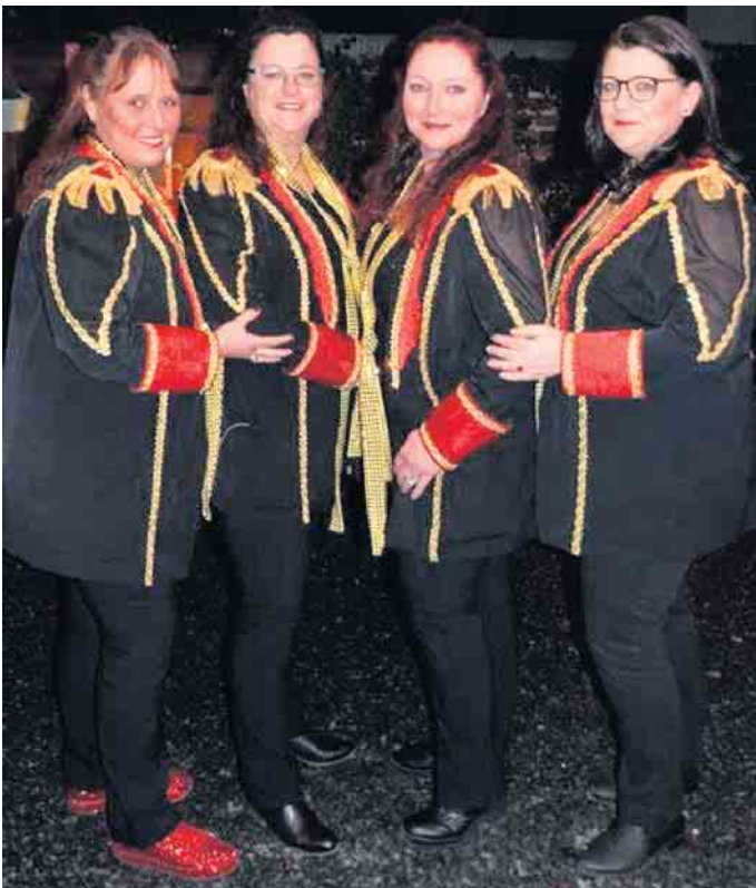
Duria Express - 4 Powerfrauen geben Gas auf der After Zoch Party in Poll