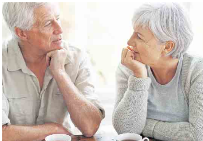
Immer mehr Menschen entscheiden sich selbstbewusst bereits zu Lebzeiten für alternative Bestattungsformen.