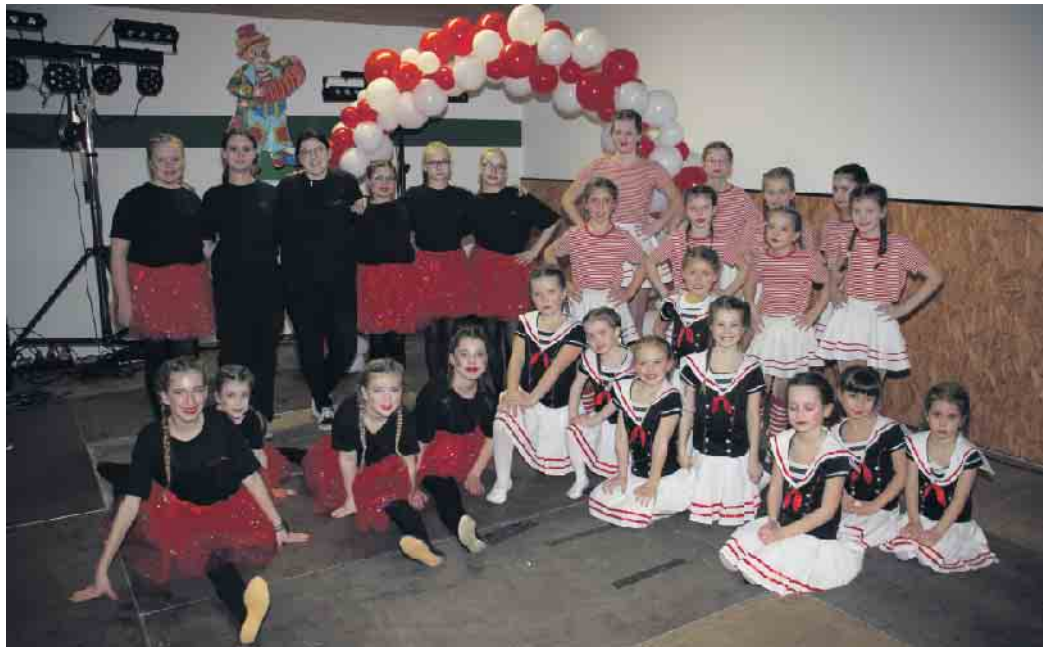
Die „Dance Pänz“ (l.) der KG sowie die „Kleinen und großen Wissensheimer Wibbelstetze“ (r.) präsentierten ihre Tänze.

Schützenhalle. Das Tanzcorps „Rote Husaren“ und das Männerballett „Firewalker“ aus