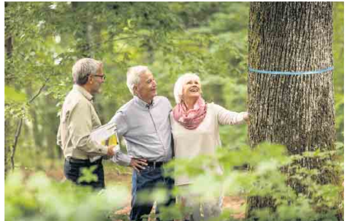
Ein freier Baum, der als Ruhestätte infrage kommt, ist mit einem farbigen Band markiert.

Eine Übersicht über alle Termine der kostenlosen Waldspaziergänge ist unter www.friedwald.de/waldfuehrungen zu finden. Dort kann man sich auch direkt anmelden. Für die Angehörigen ist es später kein Problem, die Grab-