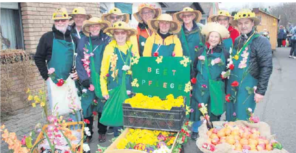
Die örtliche Beet Pflege Gruppe hatte für die Zuschauer am Wegesrand Primeln und vieles mehr mit dabei