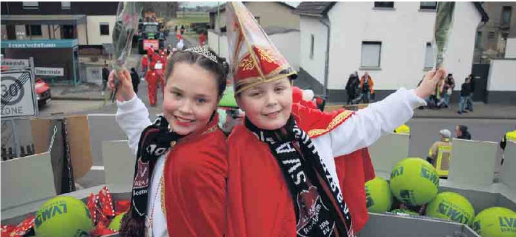
Der Wettergott war mit den Jecken gut gesonnen, was ganz besonders das 1. Zwilling-Kinderprinzenpaar freute

Zum Karnevalszug kommen die Jecken von Nah und Fern