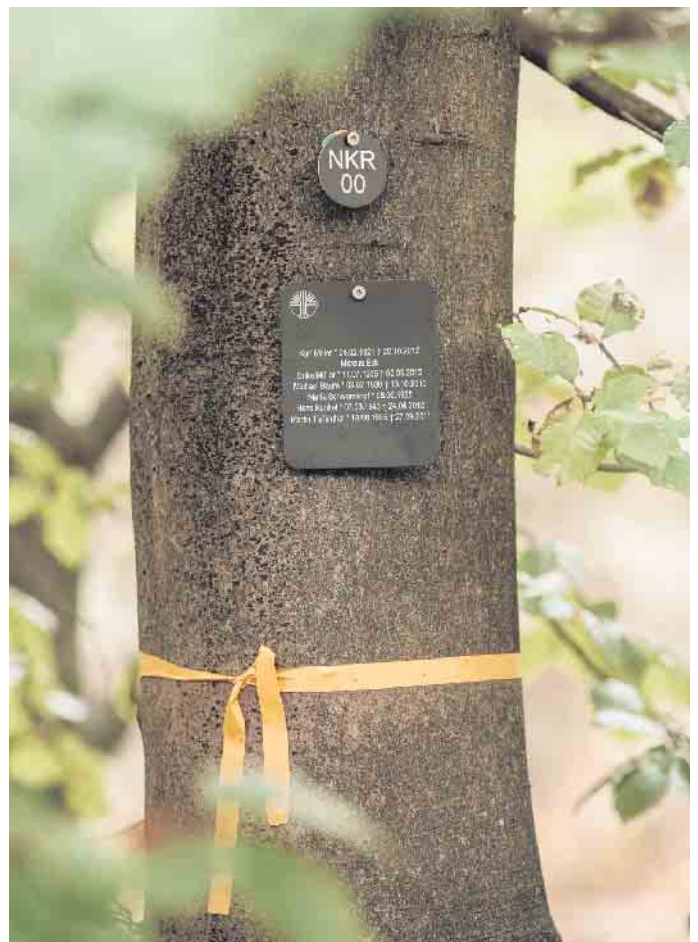
Jeder Baum, der ein Grab beherbergt, ist mit einer Nummer gekennzeichnet. Eine Namenstafel erinnert an die Verstorbenen.