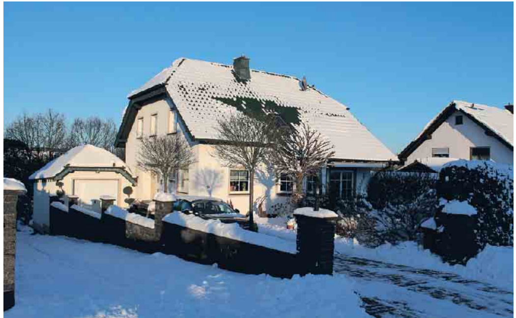
Dächer werden durch vielfältige Witterungen und Temperaturunterschiede beansprucht. Ein regelmäßiger Check sorgt für Sicherheit.

Der Zentralverband des Deutschen Dachdeckerhandwerks (ZVDH) rät daher allen Hausbesitzern und Hausverwaltungen, nach dem Winter das Dach und seine Bauteile überprüfen zu lassen. Nur so können mögliche Schäden rechtzeitig behoben werden. Im Rahmen eines DachChecks wird das gesamte Dach einer gründlichen Sichtprüfung unterzogen. Dabei erkennen erfahrene Dachdecker-Innungsbetriebe Schwachstellen bereits durch eine erste Inaugenscheinahme. So werden zum Beispiel alle funktionswichtigen Einbauelemente auf mögliche Undichtigkeiten überprüft, die Verklammerungen und Befestigungen der Dachziegel kontrolliert sowie Dachdurchdringungen bei Satellitenschüsseln, Lüftungen und Dachfenster begutachtet. Ein umfassendes DachCheck-Protokoll gilt als Inspektionsschadensnachweis und dient im Falle eines Versicherungsschadens als Vorlage beim Gebäudeversiche-