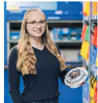
Kaufleute für Groß- und Außenhandelsmanagement sorgen für einen reibungslosen Warenfluss.

Kaufleute für E-Commerce betreuen Onlineshops, entwickeln Marketingmaßnahmen, analysieren Prozesse und vieles mehr. Auch im Technischen Handel wächst der Onlinebereich kreativ und dynamisch - ein Zukunftsberuf für PC- und Internetfans. (akz-o)