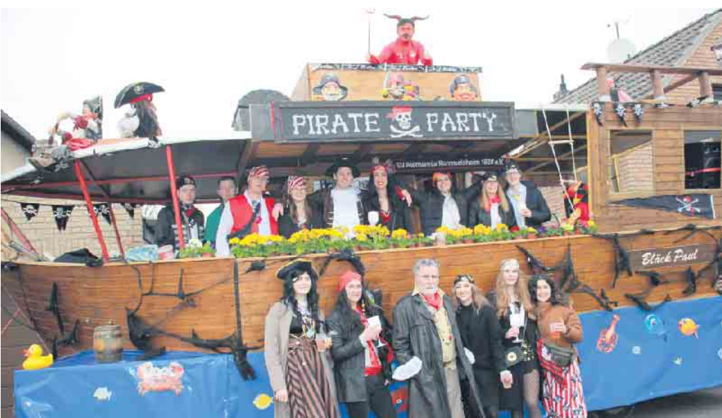
Das Piratenschiff aus der Karibik mit dem SV Alemannia Rommelsheim 1928 e.V.