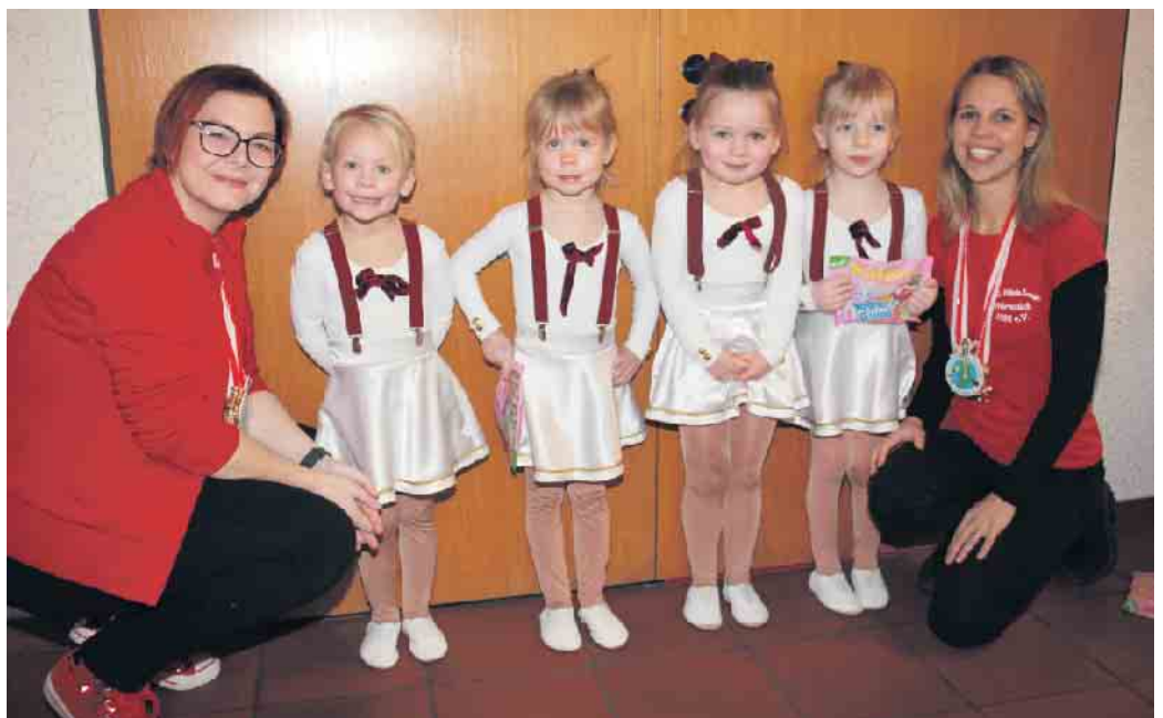
Die Mini-Garde der Fidele Jonge

freundeter Vereine hatte für jeden Pänz etwas zu bieten. Allesamt präsentierten ihre Darbietungen auf der Bühne und erteten dafür von Publikum großen Applaus. Ein großer Dank gilt den fleißigen Helfern aus allen Gruppierungen der Fidele Jonge, die den Service durchgeführt haben. FH