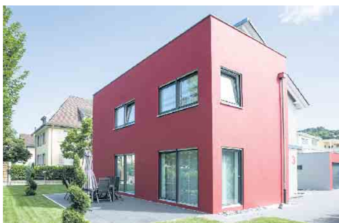
Fassadenfarben setzen markante Akzente und bieten oft weitere Funktionen, wie den Schutz vor dem Ausbleichen oder Aufheizen der Fassade durch die Sonne.

Neben Farbe und Putz spielt Klinker eine große Rolle. Häuser mit Klinkerriegeln prägen das Straßenbild ganzer Regionen beispielsweise im Norden und Westen Deutschlands. Das klassische Material wird heute mit einer noch größeren Vielfalt an Farben und Formaten wiederentdeckt. Die moderne Klinkerfassade erlaubt besondere Gestaltungen, gerade im Rahmen der Fassadendämmung. Die Basis dafür bildet stets ein Naturmaterial: Lehm, der entweder zu Klinkern gepresst oder zu Ziegeln geformt und anschließend gebrannt wird. (djd)