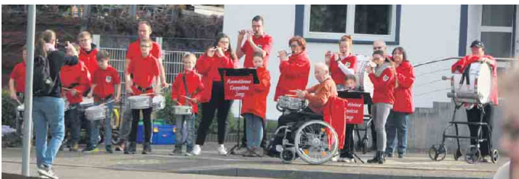
Dieses krönten die Knöpfelches Jonge mit einigen musikalischen Stücken