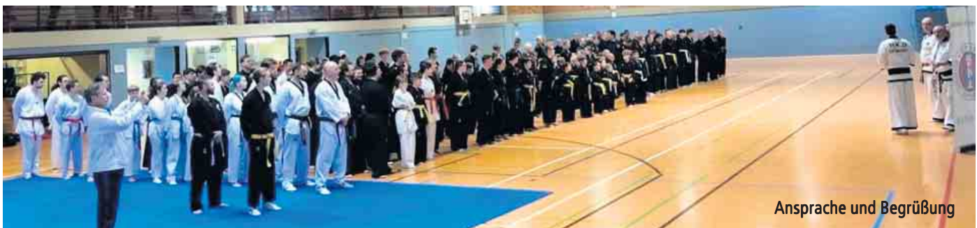
Ansprache und Begrüßung

Hapkido ist eine koreanische Kampfkunst, die sich durch fließende kontrollierte Bewegungsabläufe auszeichnet. Seit 2017 wird neben Taekwondo auch Hapkido in Nörvenich praktiziert. Am 22. April fand aus diesem Grund ein Schülerseminar in der Sport-