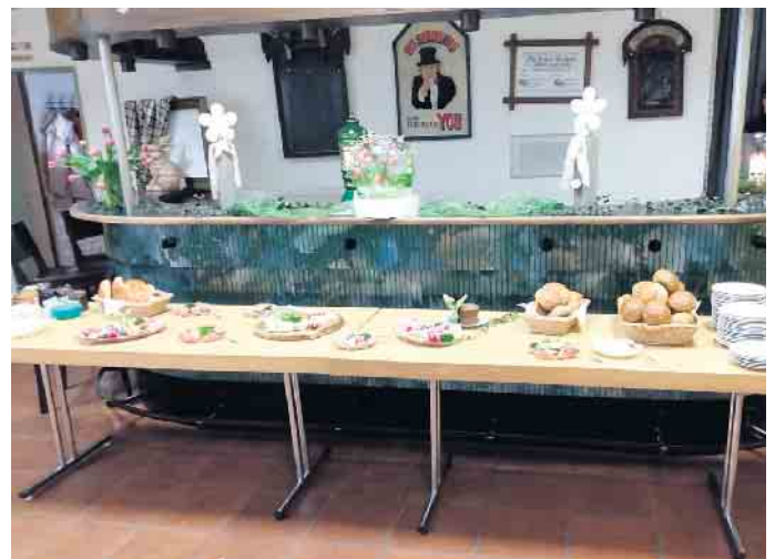
Ein Grund zum Feiern: Fünf Jahre Frühstückstreffen in Frauwüllesheim

Das Team findet auch in der Dorfgemeinschaft viel Unterstützung, vor allem bei den Männern, die gern bereit sind, die Tische und Stühle zu stellen. So wird am Tag vor dem Frühstück mit viel Liebe der Raum gestaltet und alles für den kommenden Tag so weit wie