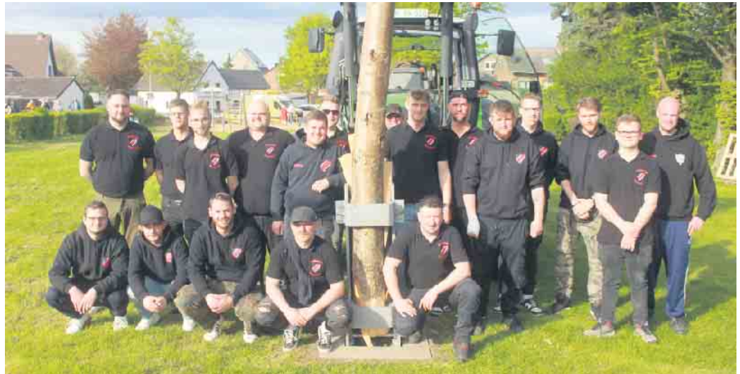
Nach genau 365 Tagen war es am letzten Sonntag endlich wieder soweit! Die Maijugend aus Rommelsheim konnte erneut ihre Mainacht feiern

Endlich war wieder Mainacht-Leben, endlich wieder ein prächtiger Maibaum, endlich wieder etwas Geselligkeit und Miteinander. Die Gäste genossen sichtlich die Wohlfühlmomente. Die Maijugend hat dafür mit kühlen Getränken, Herzhaftem (darunter der berühmte Pulled Pork Burger aus frischen Zutaten) auf dem Gelände hinter der örtlichen Feuerwehr versucht, Hunger und Durst zu stillen und ein bisschen zur Geselligkeit beizutragen. Heimliches Highlight für Alle ist natürlich das Aufstellen des Dorfmaibaumes am Spielplatz gewesen. Zuvor hatten die Kinder die Birke mit farbenfrohen Plüme aus Krepppapier geschmückt. Mit Manneskraft und der Unterstüt-