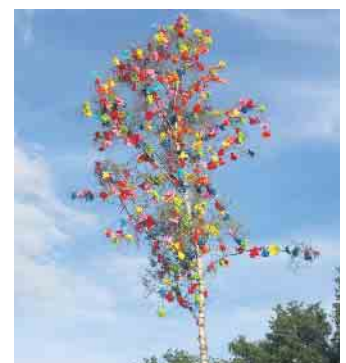
Endlich war wieder Mainacht-Leben, endlich wieder ein prächtiger Maibaum, endlich wieder etwas Geselligkeit und Miteinander