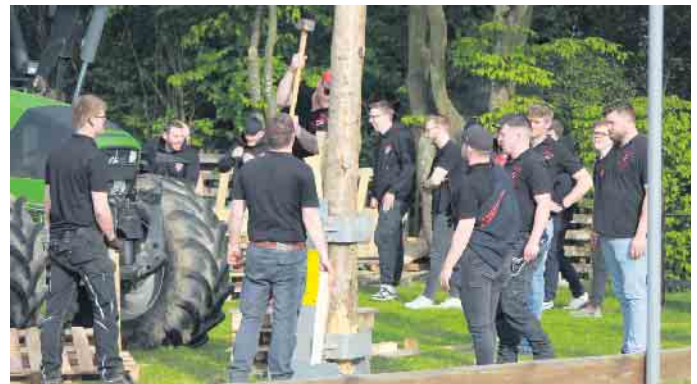
Tradition bedeutet auch echte Handarbeit