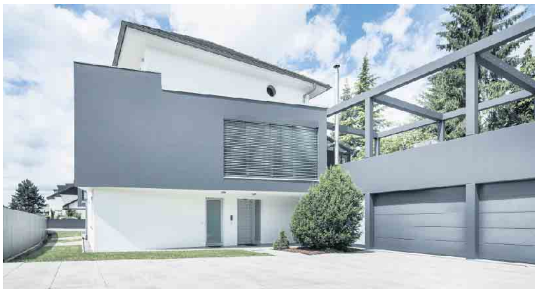
Die Fassade hat nicht nur eine schützende Funktion - sie bildet gleichzeitig das Gesicht des Eigenheims.

Moderne Fassadenfarben sehen nicht nur gut aus, sondern bieten oft zusätzliche Funktionen. Sie schützen vor Algen und Pilzen, vermeiden die Aufheizung der Fassade, verhindern ein Ausbleichen oder können sogar Schadstoffe abbauen. Acrylatfarben sind besonders witterungsbeständig und in vielen Farbtönen erhältlich. Dispersionsfarben bestehen aus einem Gemisch von Pigmenten, Lösungsmitteln und Bindemitteln. Sie sind ungiftig und punkten mit einem guten Preis. Auf siliziumhaltigen Fassaden kann Silikatfarbe zum Einsatz kommen, die auch als Mineral- oder Wasserglasfarbe bekannt ist. Sie geht