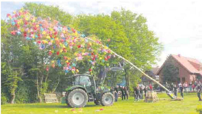
Heimliches Highlight für Alle ist natürlich das Aufstellen des Dorfmaibaumes am Spielplatz gewesen

den zahlreichen Besucherinnen und Besuchern auf dem Gelände hinter der örtlichen Feuerwehr. Der Baum steht, die bunten Plüme strahlen. Der Spruch stimmt im übertragenen Sinn, aber in der Mainacht auch wortwörtlich: Wenn alle am selben Strang ziehen, dann klappt es! Bis zum nächsten Jahr. FH