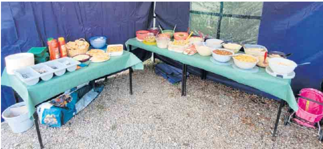
Bei den Erwachsenen kam die große Auswahl an selbst gemachten Salaten sehr gut an