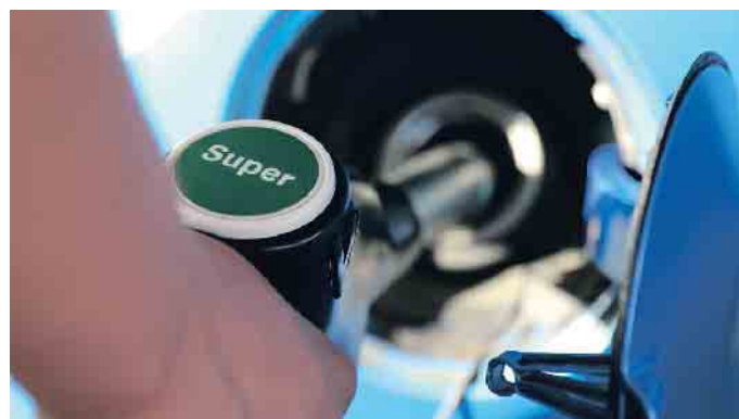
Nicht immer super: Benzin kann im Dieselfahrzeug erhebliche Schäden anrichten.

die das gesamte Einspritzsystem beschädigen können. Dazu gehören neben der Hochdruckpumpe auch Injektoren, Kraftstoffleitungen und der Tank. Viele Systemkomponenten müssen dann in der Fachwerkstatt erneuert werden - gegen eine entsprechend hohe Rechnung. (mid/ak-o)