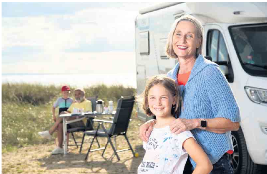
Campingurlaub ist in allen Generationen angesagt. Bevor es losgeht, sollte allerdings der Versicherungsschutz für das Wohnmobil überprüft werden.