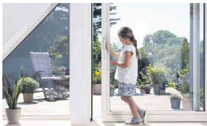
Der Trend bei modernen Schiebetüren geht hin zu großen Öffnungsweiten mit hohem Lichteinfall, einem anspruchsvollen Design und einer einfachen Bedienung.

Die Soft-Close-Technik ist in vielen Lebensbereichen fest etabliert, man denke an Küchenschubladen oder Heckklappen von Autos. Bei den ungleich größeren Fensterelementen ist das Prinzip das gleiche: Es geht darum, Elemente ohne großen Kraftaufwand und Zuschlaggeräusche schließen zu können. „Auch bei Hebe-Schiebe-Türen gilt: Eine Soft-Close-Lösung bremst schwere Flügel kurz vor der Endstellung ab und zieht sie anschließend sanft in die Verschlussposition“, erläutert VFF-Geschäftsführer Lange. Verstärken lässt sich die leichtgängige Bedienung durch den Einsatz von Kompaktlaufwagen, auf denen sich die Hebe-Schiebe-Türen bewegen, wenn sie geöffnet oder geschlossen werden. Ihre Konstruktion ermöglicht die optimale Verteilung des Flügelgewichts auf die Laufrollen. „Das sorgt nicht nur für die bewährte Leichtgängigkeit, sondern auch für eine erstklassige Wärmedämmung“, hebt Lange hervor.