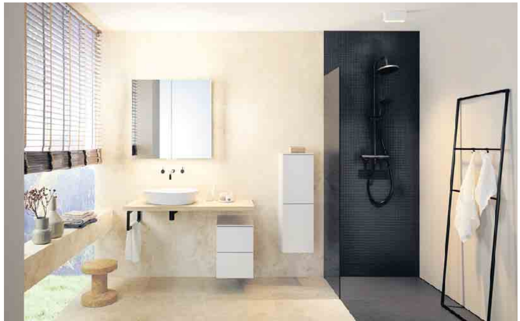
Mit den richtigen Möbeln werden Badezimmer dauerhaft sicher und komfortabel zum individuellen Wohlfühlort.

Das Badezimmer hat sich von der Nasszelle zum Wohlfühlort für Körper und Geist entwickelt. In immer mehr Haushalten wird es mit Bedacht auf ästhetische wie auch funktionale Merkmale eingerichtet. Die Deutsche Gütegemeinschaft Möbel (DGM) erklärt, worauf es bei der Auswahl und Pflege von Badmöbeln ankommt, damit sie den klimatischen Bedingungen gewachsen sind. Badezimmermöbel wie Schränke und Regale, Waschtische und Spie-