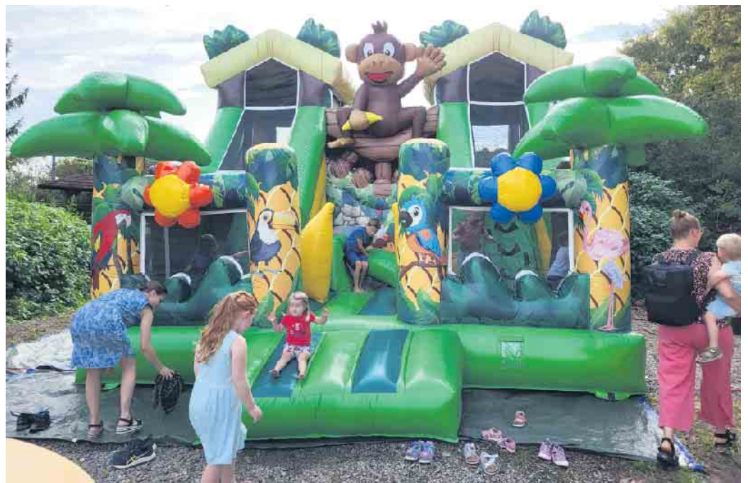
Strahlende Kinderaugen gab es beim Anblick der tollen Hüpfburg

beim Anblick der großen Hüpfburg, den lustigen Ballonfiguren und den Spielen auf dem neu gestalteten Platz hinter dem Bürgerhaus in der Josefstraße. Bei den Erwachsenen erzielten leckere Cocktails, gut gebräuntes Grillfleisch und eine große Auswahl an selbstgemachten Salaten die gleiche Wirkung. Die KG Ahle Hoot hatte ihre Mitglieder und deren Freunde zum Sommerfest geladen und es wurde eine gesellige Feier bis tief in die Nacht. Gleichzeitig hatten alle Anwesenden die Gelegenheit die neue Vereinskleidung mit Polo-shirts, Sportjacken und Hosen nicht nur zu bestellen, sondern dank einer mobilen Boutique auch anzuprobieren und dann gezielt auszuwählen. Bei karnevalistischen Klängen konnten sich auch manche Neuzugänge des Vereins untereinander kennenlernen und einfach ein kleines Schwätzchen halten.