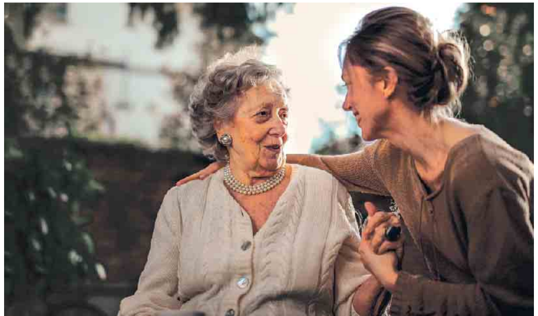
Die Liebsten entlasten und selbst auf der sicheren Seite sein mit einem Bestattungsvorsorgevertrag.

Seriöse Bestatter bieten vor Ort persönliche Bestattungsvorsorge-