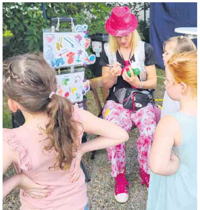
Lustige Ballonfiguren erfreuten die kleinen Besucher

beim Anblick der großen Hüpfburg, den lustigen Ballonfiguren und den Spielen auf dem neu gestalteten Platz hinter dem Bürgerhaus in der Josefstraße. Bei den Erwachsenen erzielten leckere Cocktails, gut gebräuntes Grillfleisch und eine große Auswahl an selbstgemachten Salaten die gleiche Wirkung. Die KG Ahle Hoot hatte ihre Mitglieder und deren Freunde zum Sommerfest geladen und es wurde eine gesellige Feier bis tief in die Nacht. Gleichzeitig hatten alle Anwesenden die Gelegenheit die neue Vereinskleidung mit Polo-shirts, Sportjacken und Hosen nicht nur zu bestellen, sondern dank einer mobilen Boutique auch anzuprobieren und dann gezielt auszuwählen. Bei karnevalistischen Klängen konnten sich auch manche Neuzugänge des Vereins untereinander kennenlernen und einfach ein kleines Schwätzchen halten.