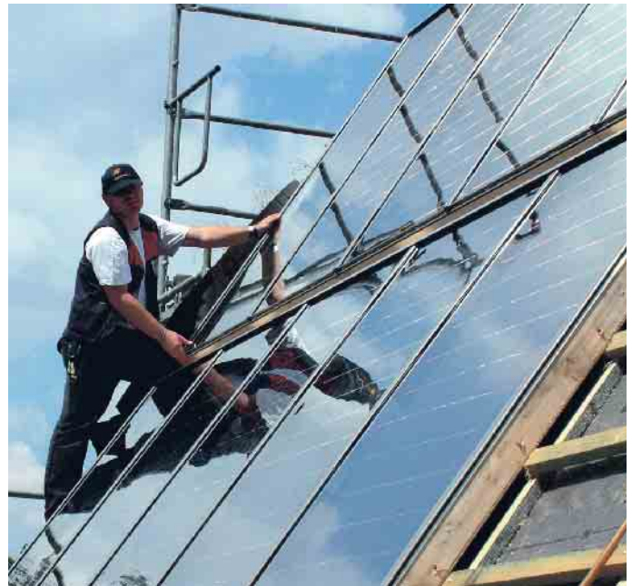
Photovoltaik: Dachdecker wissen, was zu tun ist.

Um Schäden zu vermeiden, sollte ein Innungsbetrieb des Dachdeckerhandwerks zurate gezogen werden, denn er kennt sich mit den Auswirkungen beim Aufbringen von PV-Modulen auf die Statik des Daches aus. Auch müssen die einzelnen Module der Anlage sicher befestigt werden, damit es nicht zu Schäden durch z. B. Windsog oder Schneelast kommt. Dazu muss man wissen, in welchem Windzonengebiet das Eigenheim steht. Deutschland ist in vier unterschiedliche Kategorien eingeteilt, die Auskunft darüber geben, welche Windgeschwindigkeiten für verschiedene geografische Regionen gelten. Damit einher gehen bestimmte Anforderungen an die Befestigung von Ziegeln, aber auch von PV-Anlagen. Und um Feuchteschäden zu verhindern, müssen die Befestigungselemente und Kabeldurchführungen auf das Dachmaterial abgestimmt und fachgerecht eingebaut werden. Außerdem dürfen das Dachmaterial und die Unterkonstruktion bei der Montage nicht beschädigt werden. Ein weiterer wichtiger Aspekt sind Wartungswege: Diese sind unbedingt einzuplanen, damit später die Module für Reinigung und Kontrolle zugänglich sind. Wer mehr wissen möchte, findet umfassende Informationen und direkt auch den passenden Dachdeckerbetrieb auf dieser Website: www.pv-dachdecker.de