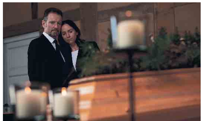
Die Liebsten entlasten und selbst auf der sicheren Seite sein mit einem Bestattungsvorsorgevertrag.