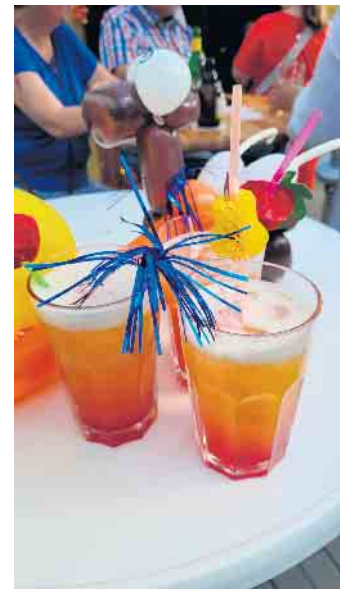
Spitzenreiter an der Cocktailbar war der „Touch Down“