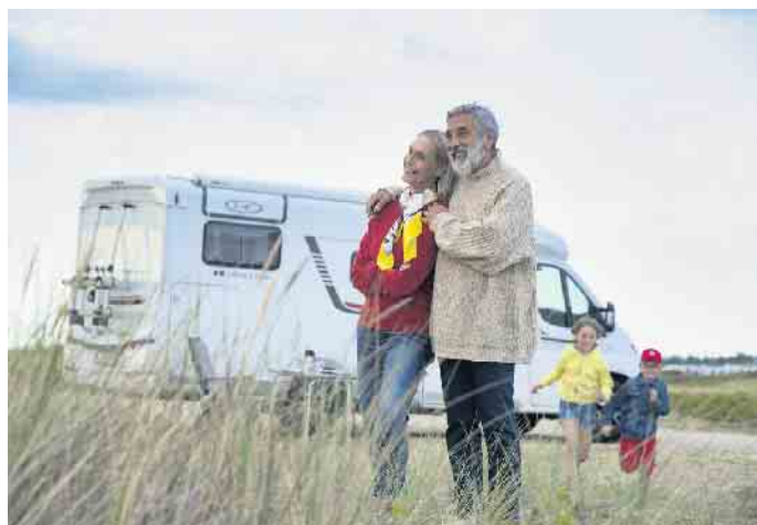
Wohnmobile benötigen wie jedes andere Kfz eine Haftpflichtversicherung, diese übernimmt aber lediglich Unfallschäden am fremden Fahrzeug. Darüber hinaus sollte eine Teilkasko- oder Vollkaskoversicherung abgeschlossen werden.

Sogenannte Folgeschäden sind in der Kasko optional mitversichert. Ein Beispiel: Der Camper fährt mit alten Reifen, zu wenig Luftdruck oder überfährt Gegenstände. Platzt der Reifen, beschädigt das Gummi Radkasten und Unterboden. Der Reifen wird in diesem Fall zwar nicht ersetzt,