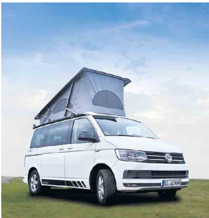
Auf individuell konfigurierte Campingmobile muss man heute lange warten. Bevor es dann endlich losgeht, sollte man noch den Versicherungsschutz checken.