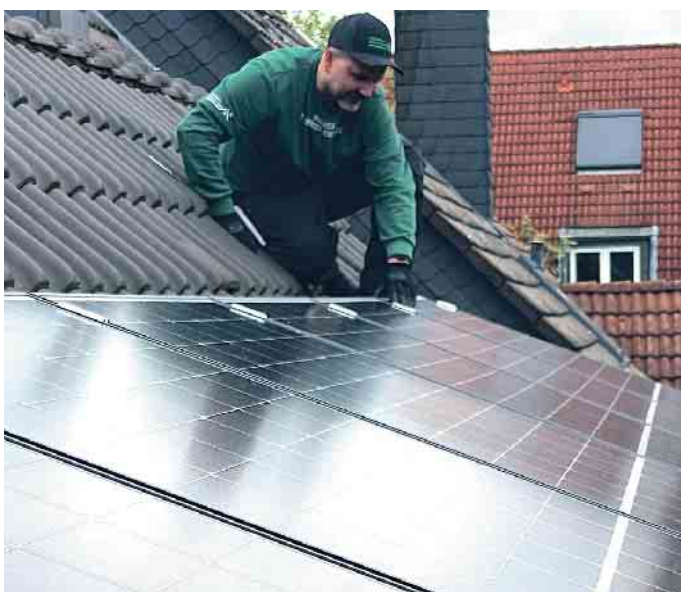
Dachdecker: Ihr Ansprechpartner, wenn es um PV geht.

Dachdeckerfachbetriebe haben die Erfahrung und Routine, all die genannten Punkte umzusetzen. Sie beraten, führen alle Arbeiten fachgerecht durch und bauen in Kooperation mit Betrieben aus dem Elektro-Handwerk sichere und nachhaltige Anlagen ein. Auch kennen sie sich mit den aktuellen Förderprogrammen aus. (akz-o)